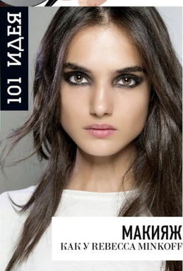
МАКИЯЖ КАК У REBECCA MINKOFF