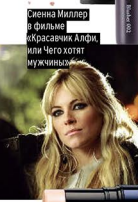
Сиенна Миллер в фильме Красавица Алифили Чтого хотят мужчины?