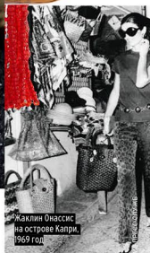
Жакини Онассис на острове Капри, 1969 год

Нанесите на влажные волосы любое подходящее вам масло и подсушите феном. Расчешите пряди по всей длине и сделайте прямой пробор. При желании полностью соответствовать оригиналу воспользуйтесь коническими щипцами, завив локоны от кончиков до середины длины. Уберите волосы за уши при наличии крупных серег.