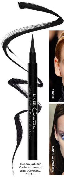
Подводка Liner Couture, оттенок Black, Givenchy, 2313 р.