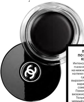
Кремовая подводка Calligraphie de Chanel, оттенок Hyperblack, Chanel, около 2 390 р.