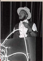
DJ Kiddy Smile