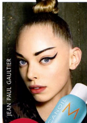
JEAN PAUL GAULTIER