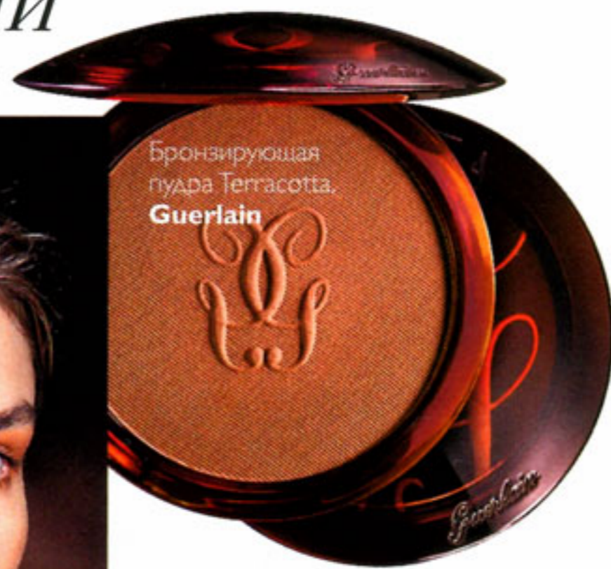
Бронзирующая пудра Terracotta, Guerlain