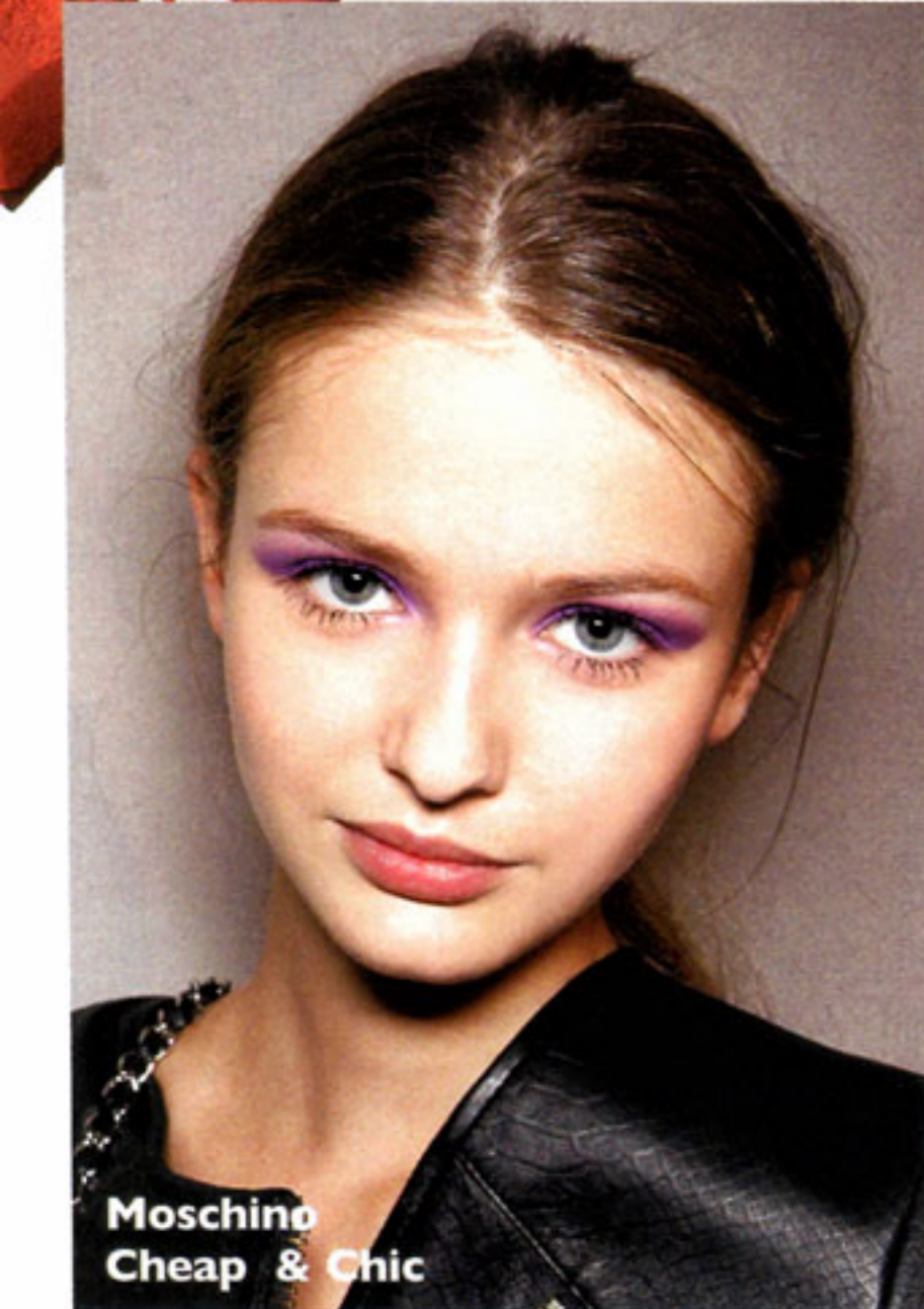
Moschino Cheap & Chic

Девушкам, предпочитающим стиль baby doll, понравятся все оттенки розового и насыщенная фуксия. Они сделают образ немного легкомысленным, нежным и по-летнему свежим.