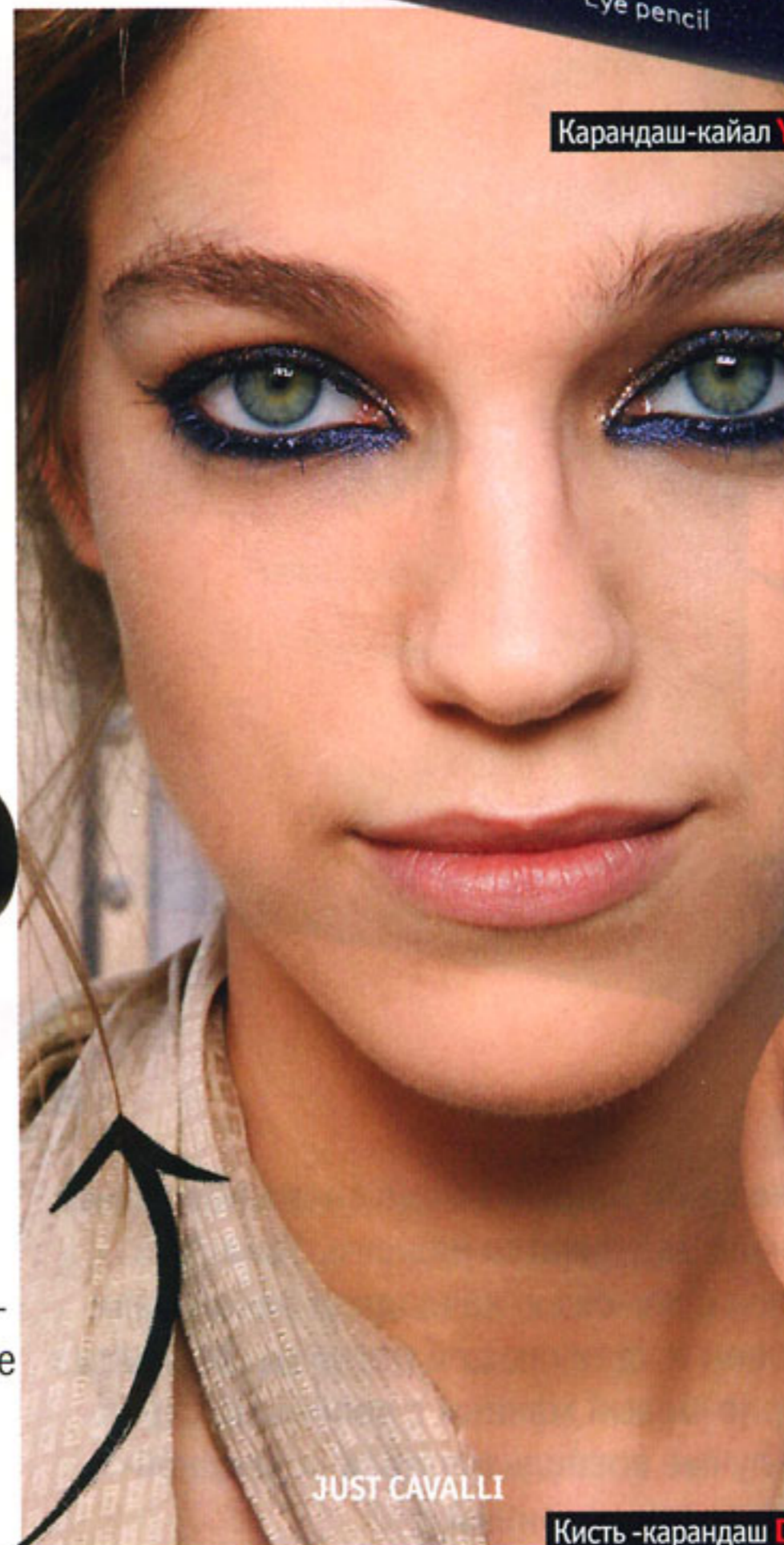
Карандаш-кайал Yves Rocher Crayon Regard №51, 150 руб.