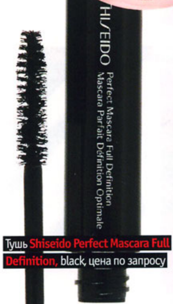
Тушь Shiseido Perfect Mascara Full Definition , black, цена по запросу