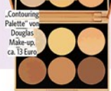
„Contouring Palette“ von Douglas Make-up, ca. 13 Euro