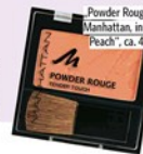
„Powder Rouge“ von Manhattan, in „Fresh Peach“, ca. 4 Euro