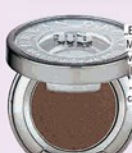
Eyeshadow „Moudukt“ von Urban Decay, in „Busted“, ca. 18 Euro